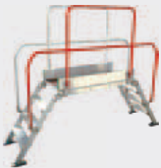
PLATTFORMGELÄNDER (bei Bestellung bitte die Größen angeben) Best.-Nr. DIPAR-90 PLATTFORMGELÄNDER (bei Bestellung bitte die Größen angeben) Best.-Nr. DIPAR-120