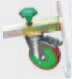
BASIS MIT ROLLEN Best.-Nr. DI-TESTATA