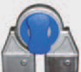
GELENK AUS GUSSALUMINIUM Best.-Nr. SNODOPN