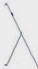
TELESKOP-AUSLEGER Best.-Nr. PN-STAB