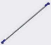
DIAGONALSTREBE MIT BEFESTIGUNGS- SYSTEM Best.-Nr. PN-SAET1555