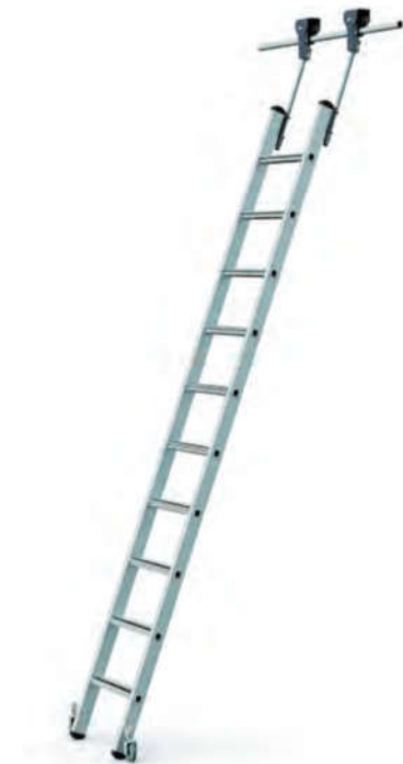
Fahrbare Regalleiter in Ruhestellung

Bitte bei Bestellung das senkrechte Maß von Boden bis Oberkante Rohrschiene angeben!