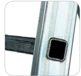
30x30 mm quadratische Sprossen.