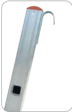
ZUBEHÖR: Einhängehaken aus Stahl.