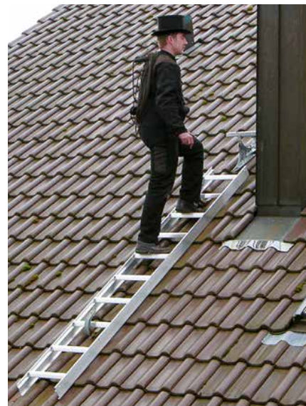
Abb. Bestell-Nr. 11113