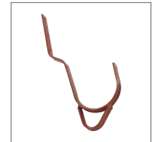
Abb. Bestell-Nr. 11119