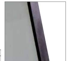
Abb. Bestell-Nr. 11211