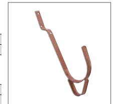
Abb. Bestell-Nr. 11219