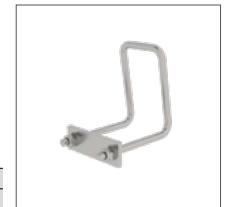
Abb. Bestell-Nr. 11204