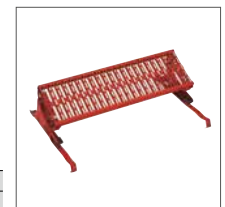
Abb. Bestell-Nr. 11175