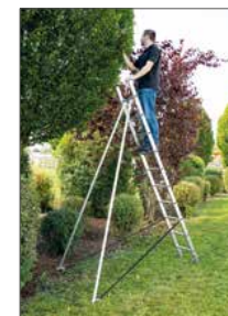
Abb. Bestell-Nr. 19945