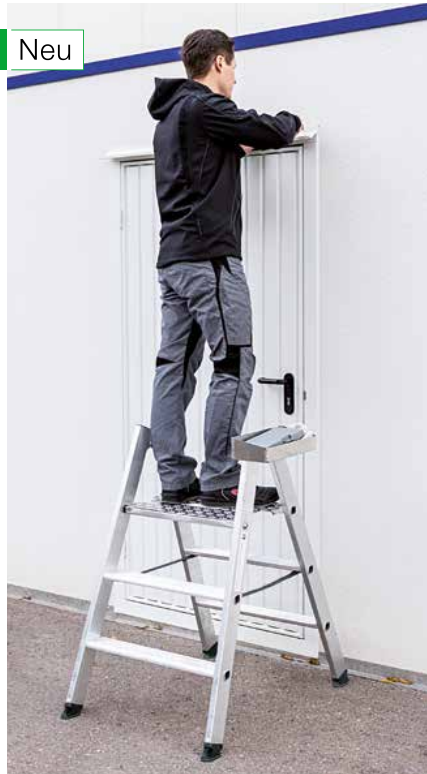
Abb. Bestell-Nr. 50183 mit Bestell-Nr. 50187