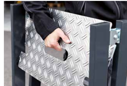
Leicht im Transport dank integriertem Griffloch

Details und Komplettübersicht ab Seite 204