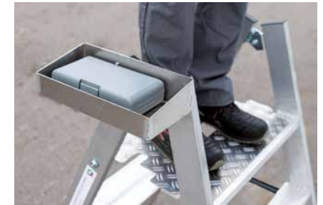
Praktisch: Die optionale Ablageschale für Werkzeug etc.