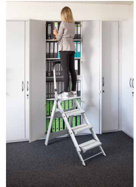
Abb. Bestell-Nr. 53104