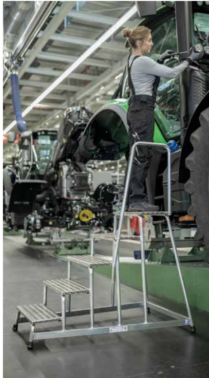
Abb. Bestell-Nr. 50045