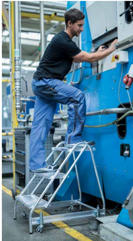
Abb. Bestell-Nr. 50051 und Bestell-Nr. 50069