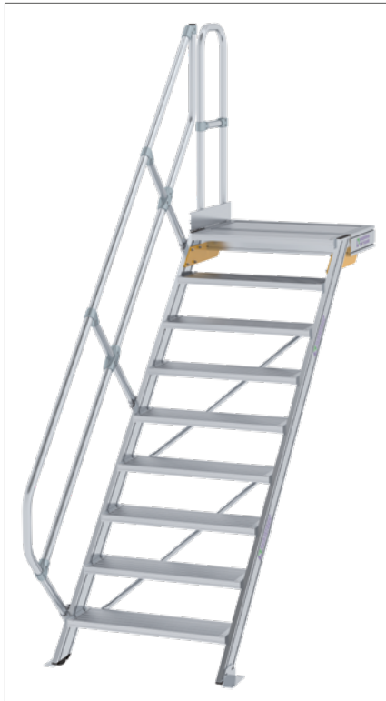
Abb. Bestell-Nr. 600449