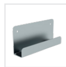
Leiterwandhalter L Bestell-Nr. 19839