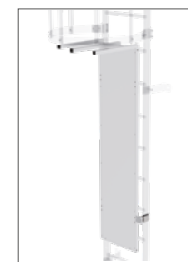
Abb. Bestell-Nr. 63498 in bestehender Leiter