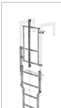
Abb. Bestell-Nr. 63506 montiert an Pflichtzubehör Ausstiegsholm abgewinkelt Bestell-Nr. 63049