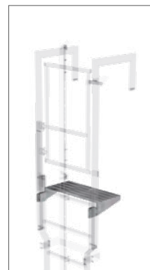
Abb. Bestell-Nr. 63975