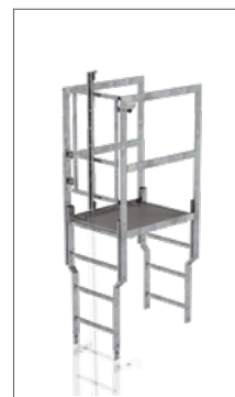
Abb. Bestell-Nr. 63507 bestehend aus Attika-Überstieg, 2 Leiterteile, 1 Sicherungstüre mit Steigschutzschiene

Längere Lieferzeiten durch auftragsbezogene Fertigung