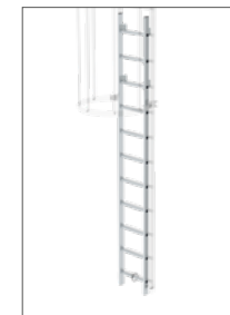
Abb. Bestell-Nr. 61445 in bestehender Leiter