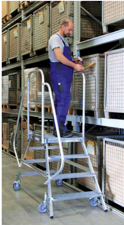
Abb. Bestell-Nr. 51204 mit Handlauf Bestell-Nr. 50209

Entdecken Sie die vielen Produktvorteile als Video: www.steigtechnik.de/videos