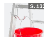
Eimerhaken für Sprossenleitern