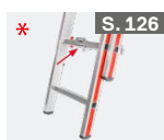
Klemmbeschlagset für Treppenstellung