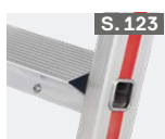
Aufsetzstufen für Sprossenleitern