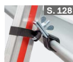
Leiterhalterset für Dachrinnen