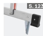
Fußspitzenset für Traversen