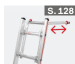
Wandabstandshalter für Sprossenleitern