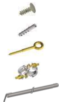
Befestigungspaket Typ 1