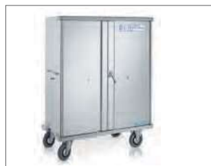
Schrankwagen W 105 N