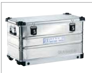
Mobil Box K 424 XC – GGV

Das breite Spektrum an Standardprodukten bietet in den meisten Fällen eine Vielzahl von Lösungen, die höchste Anforderungen erfüllen. Neben der K470 finden Sie hier einen Auszug der gängigsten Baureihen: