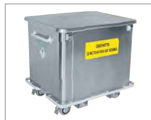
Mehrweg-Transportbehälter UN 3291