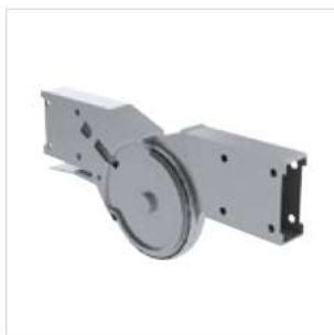
Abb. Bestell-Nr. 19474

1 Bitte Bestell-Nr. der Teleskopleiter angeben