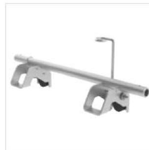
Abb. Bestell-Nr. 19424