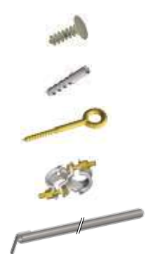
Befestigungspaket Typ 1