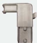
GELENK ARM + STIFT - MITTELTEIL Holmabmessung: 25 x 65 Recht Best.-Nr. FU-052