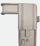
GELENK ARM + STIFT - MITTELTEIL Holmabmessung: 25 x 90 Recht Best.-Nr. FU-062