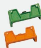
ABLAGESCHALE PRO SERIE 600 Farbe: grün Best.-Nr. PL-009 ABLAGESCHALE PRO SERIE 300 Farbe: Orange Best.-Nr. PL-006