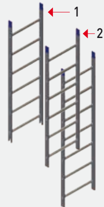
1- RAHMENTEIL GRUNDELEMENT 6 SPROSSEN CLIC Best.-Nr. PN-CLI/SPB

2- RAHMENTEIL AUFSTOCKUNG 6 SPROSSEN CLIC Best.-Nr. PN-CLI/SPA