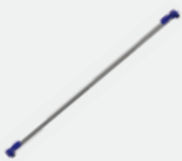
DIAGONALSTREBE MIT BEFESTIGUNGS- SYSTEM Best.-Nr. PN-SAET1555