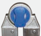
GELENK AUS GUSSALUMINIUM Best.-Nr. SNODOPN