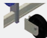
ROLLEN-HALTERUNG (OHNE ROLLE) Best.-Nr. FE-188

2- RAHMENTEIL AUFSTOCKUNG 6 SPROSSEN CLIC Best.-Nr. PN-CLI/SPA