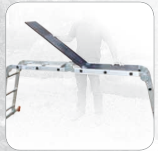
ZUBEHÖR: Plattform (29,5 x 161 cm).

HINWEIS: Als Arbeitsbühne nur mit Plattform verwenden!