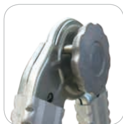
Stahlgelenke mit automatischer Suche der Positionen.