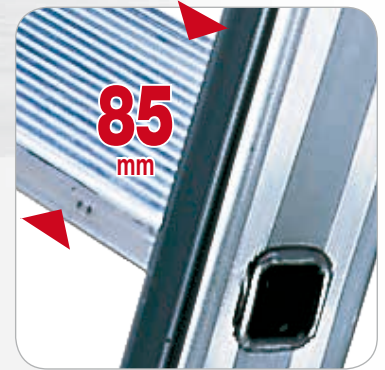
Stufentiefe 85 mm.