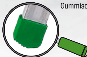
Große rutschfeste Gummischeuhe.