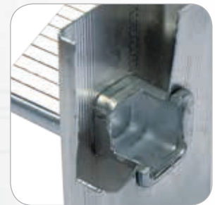
Dreifach geweitete und gebördelte Stufen-Holm-Verbindung.