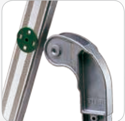
Scharniere aus Gussaluminium mit Nylonüberzug um Abrieb an den Metallteilen zu verhindern.