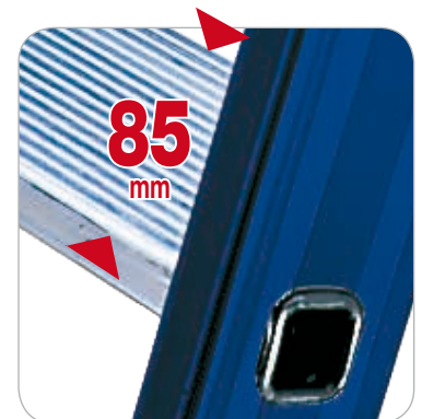
Stufentiefe 85 mm aus Aluminium natur.