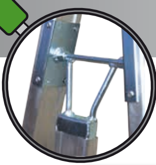
Scharnier aus Stahl.