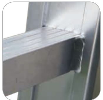
Schräge trapezförmige Sprossen. An den Holmen befestigte Sprossen sind verschweißt und durchgehend verbörd.