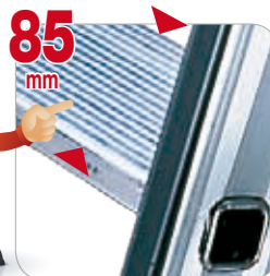
Stufentiefe 85 mm.