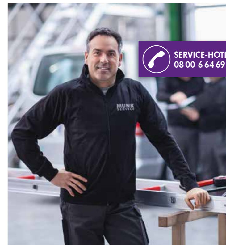
Ihr Servicepartner der GÜNZBURGER STEIGTECHNIK

MUNK SERVICE Service • Wartung • Reparatur • Prüfdienst • Montage