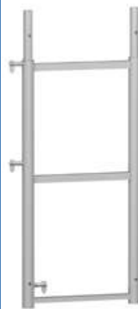
F0000 19 F0000 07