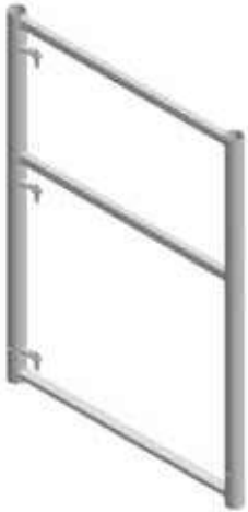
F0000 05 F0000 14

Rohrprofile \varnothing 48,3 \times 3,25 mm, unten Rechteckrohr zur Aushebesicherung der Belagbrücke. Keine nach außen vorstehenden Teile.