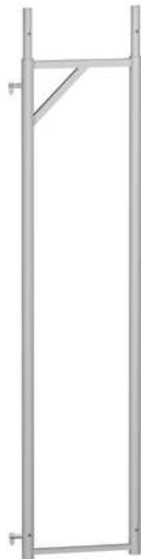
F0000 18 F0000 06