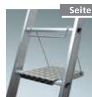
Gr. Werkzeugablage Nr. 4991041