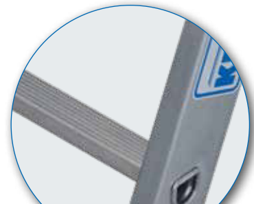
31 mm tiefe D-Sprosse

Die D-Sprosse bietet durch ihre spezielle Form stabilen Halt und eine breitere Auftrittsfläche für einen besseren Stehkomfort im Vergleich zu herkömmlichen Sprossen.