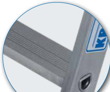
80 mm tiefe Stufen

80 mm tiefe, profilierte Stufen, wodurch die Anforderungen der TRBS 2121-2 zur Nutzung von Stufen als Arbeitsplatz sichergestellt sind.