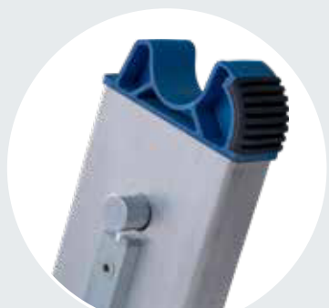
2-Komponenten-Kopf- und Fußstopfen

Stabile Steckverbindung mit komfortabler und automatischer Verriegelung (ClickMatic-System), die mit einem Handgriff wieder gelöst werden kann. Die runden Sicherungsbolzen dienen auch als Führung für ein leichtes Zusammenstecken der Leiternteile ohne zu verkeilen. Keine überstehenden Bauteile, dadurch wird eine Verletzungsgefahr deutlich minimiert.