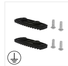
Abb. Bestell-Nr. 19216