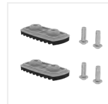
Abb. Bestell-Nr. 19220, Verwendung nur in Verbindung mit nivello® Innenschuh Bestell-Nr. 19215 - 19218