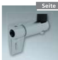
Endanschlag rechts Nr. 4998203