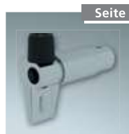
Endanschlag links Nr. 4998204