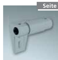
Zwischenhalter Nr. 4998202