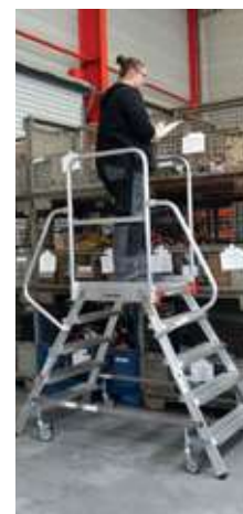
Abb.: Artikelnr. 5160105 + Artikelnr. 5990052 (Zubehör Treppengeländer)