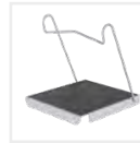
Einhängetritt R 13