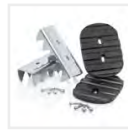
Sicherer Stand Outdoor

Neben Sets für einen sicheren Stand, gibt es auch Pakete mit praktischen Helfern oder zur Erfüllung der TRBS. Mehr ab Seite 132