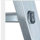
4-fach gebördelte Sprossen-/Holmverbindung

Details auf der jeweiligen Produktseite unter www.munk-group.com