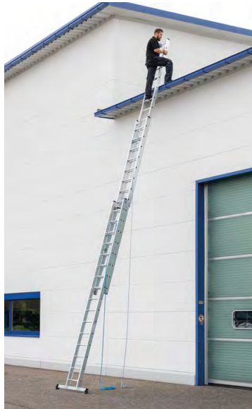
Abb. Bestell-Nr. 22416