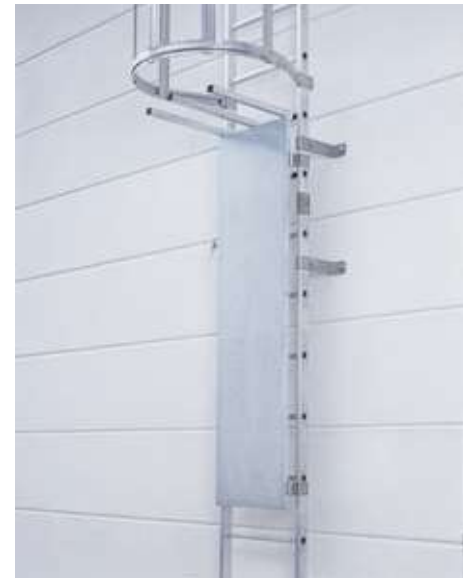
Stahl-Abschlussstür 1) Am oberen Ende Durchstiegssperre, Vorhängeschloss bauseits Artikelnr. 9663498