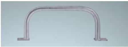
Haltegriff Mit Anschraubplatten

Stahl verzinkt, 400 mm Artikelnr. 9667216