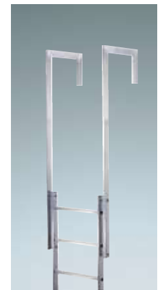
Ausstiegsholm 4) Einseitig, abgewinkelt