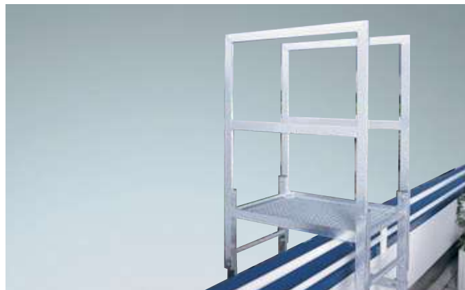
Attika-Überstieg Mit Gitterrost, Stahl verzinkt, Abstiegleiter 1220 mm lang, Ablängung bauseitig. Für den Abschluss am Abstieg empfehlen wir verstellbare Wandanker oder Fußplatten.