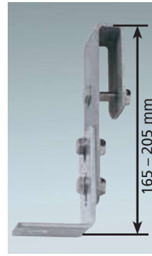
Maueranker, starr 3)