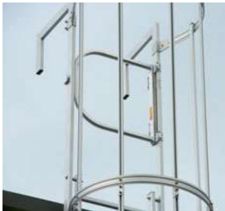
Sicherungstüre 5) Nach DIN EN ISO 14122. Automatisch schließend, Material Alu blank, Scharniere aus Edelstahl Artikelnr. 9663501