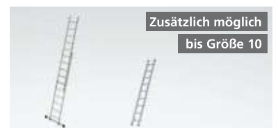
Zusätzlich möglich bis Größe 10