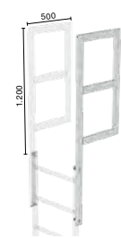
Abb. Bestell-Nr. 62050 (2 St.)