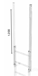
Abb. Bestell-Nr. 62243 (2 St.)