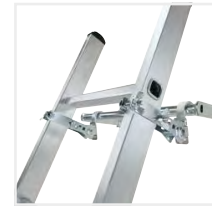
Abb. Bestell-Nr. 19315