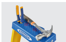
Ablageschale durch Lock-in-System mit Zubehör erweiterbar