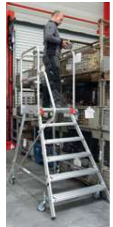
Abb.: Artikelnr. 5150106 + Artikelnr. 5990052 (Zubehör Treppengeländer)