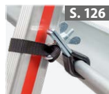
Leiterhaltersset für Dachrinnen