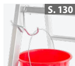
Eimerhaken für Sprossenleitern