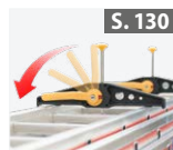
Leiterhalter- set für Dachträger