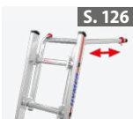
Wandabstands- halter für Sprossen- leitern