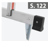
Fußspitzen- set für Traversen