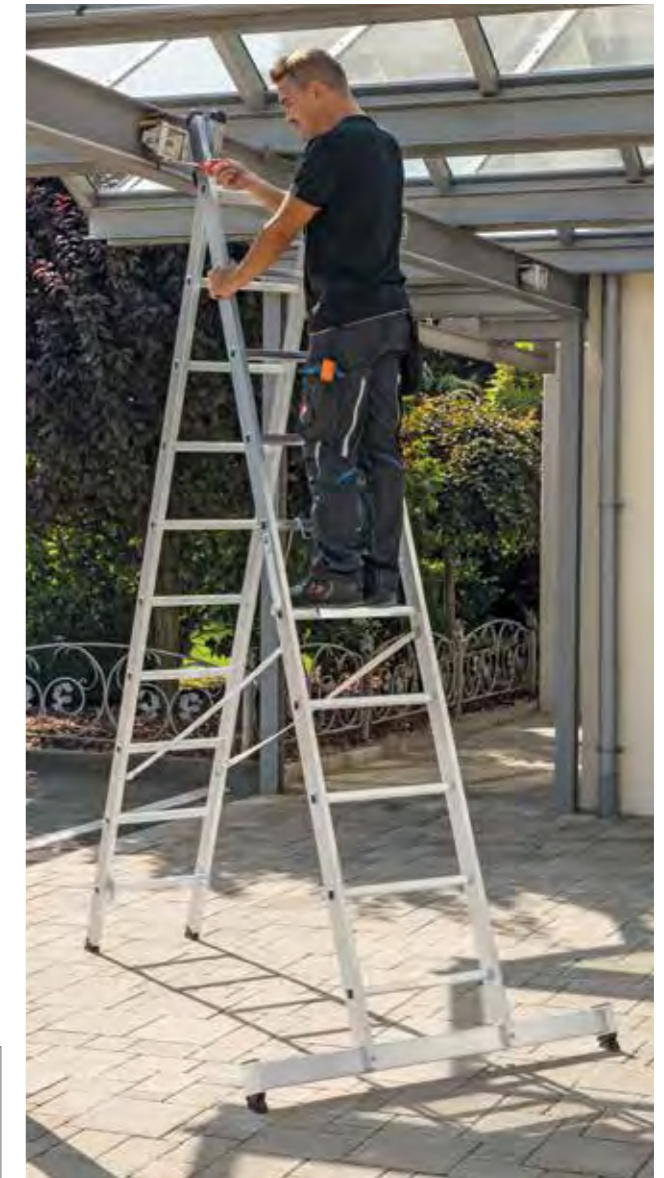
Abb. Bestell-Nr. 31220 und 19910