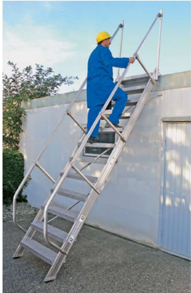
Abb. Bestell-Nr. 300232 mit 2. Handlauf Bestell-Nr. 300292

Standardausführung ist Aluminium geriffelt. Andere Beläge gegen Mehrpreis (siehe Seite 132).