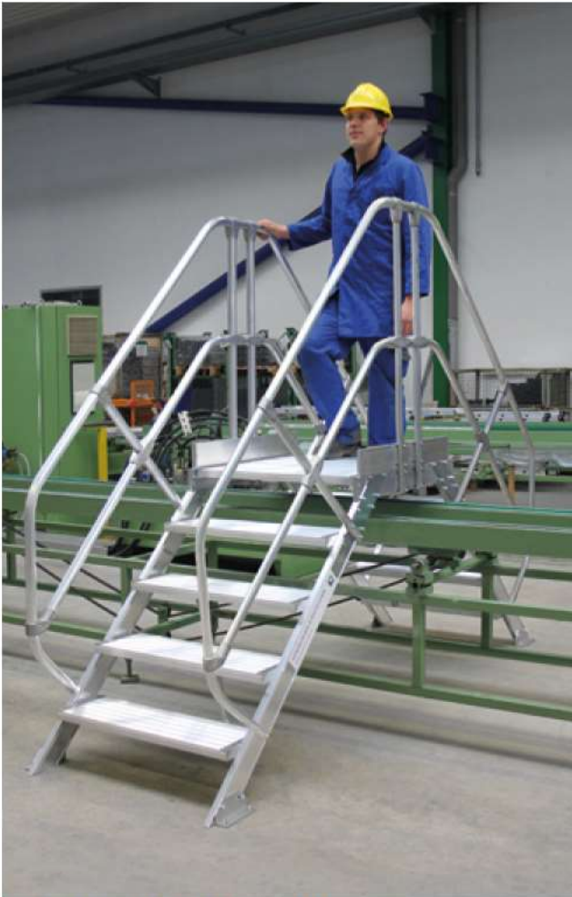
Abb. Bestell-Nr. 300945 mit 2. Handlauf Bestell-Nr. 300975