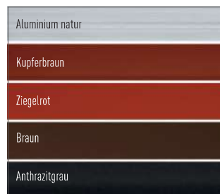
Leichtmetall-Dachleitern erhältlich in verschiedenen Farben