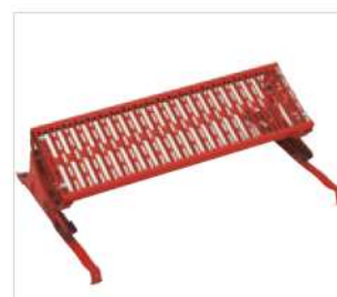
Abb. Bestell-Nr. 11176