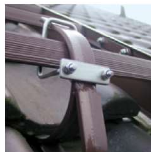
Abb. Bestell-Nr. 11204