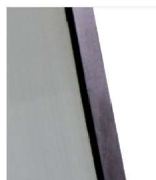
Abb. Bestell-Nr. 11211