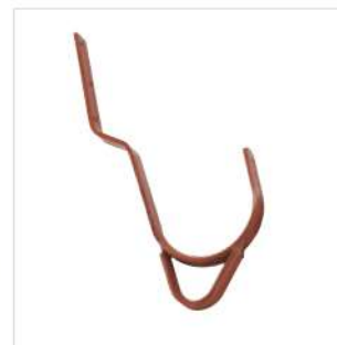
Abb. Bestell-Nr. 11119