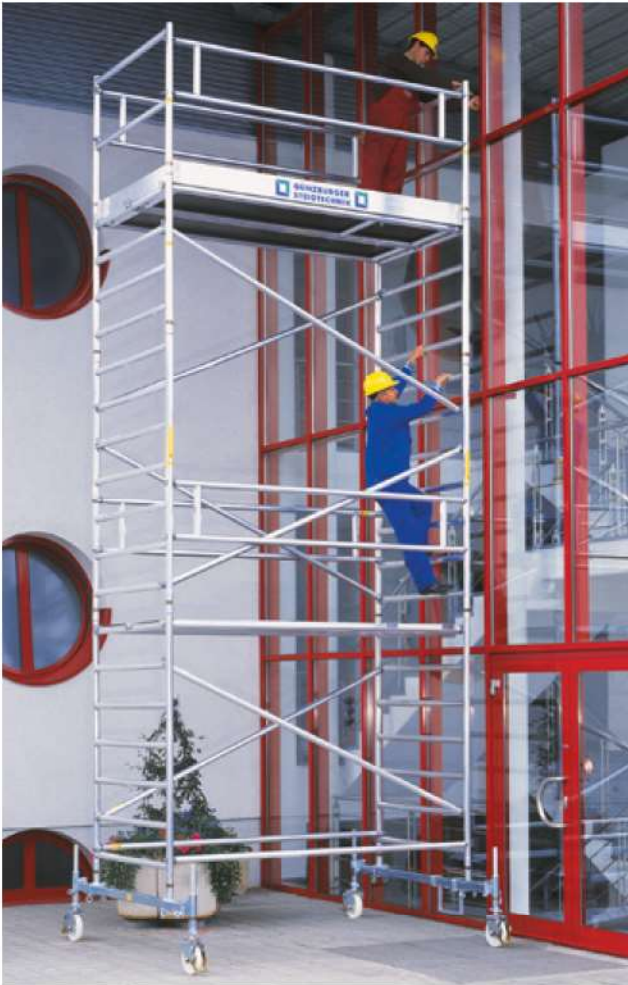
Abb. Bestell-Nr. 174535