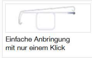
Einfache Anbringung mit nur einem Klick