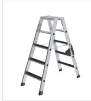
Abb. Stufenleiter Bestell-Nr. 40210 mit Nachrüstatz Bestell-Nr. 41527