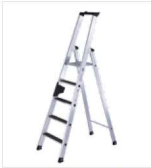
Abb. Stufenleiter Bestell-Nr. 40105 mit Nachrüstatz Bestell-Nr. 41517