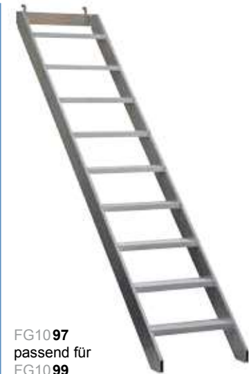
FG10 97 passend für FG10 99