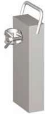
FG10 38 FG10 39