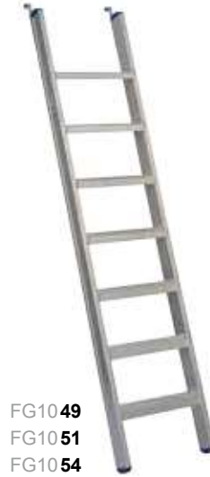
FG10 49 FG10 51 FG10 54