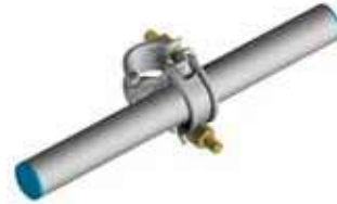
FG10 42 FG10 43